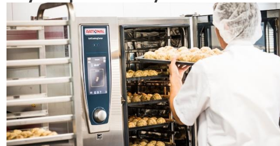
Efektivní a udržitelná výroba