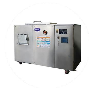
GG 30 (90kg denne)