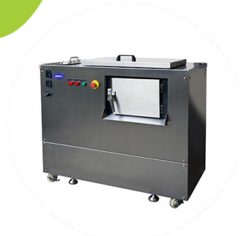
GG 10 (30kg denne)