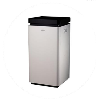
CC 02 (6kg denne)