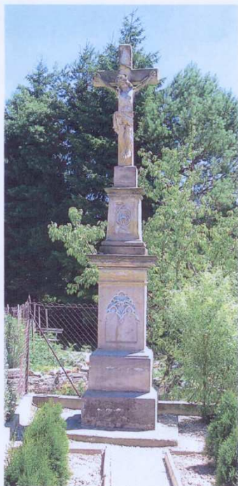
Haňovice, kamenný kříž, 2011 v místní části Kluzov Celkový pohled na kříž před zahájením restaurátorských prací.