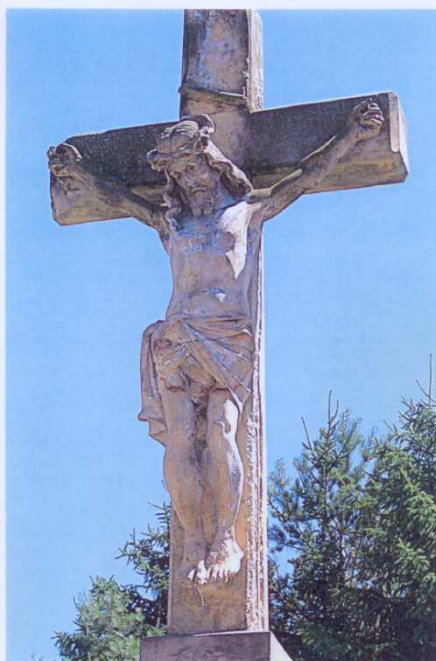
Haňovice, kamenný kříž, 2011 v místní části Kluzov Detail vrcholového kříže s postavou Krista před zahájením restaurování. Povrch kamene byl zvětralý, s patrnými korozními výdoly. Horní nároží vodorovného břevna vlevo bylo uražené. Na mnoha místech byly patrné zbytky degradovaného nátěru.