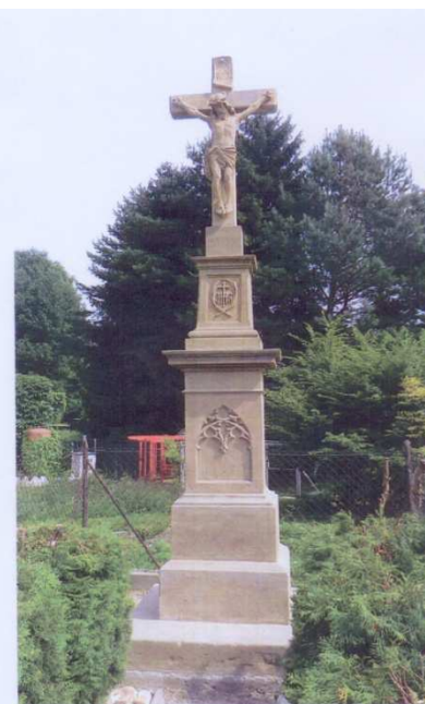
Haňovice, kamenný kříž, 2011 v místní části Kluzov Celkový pohled na kříž po dokončení restaurátorských prací.