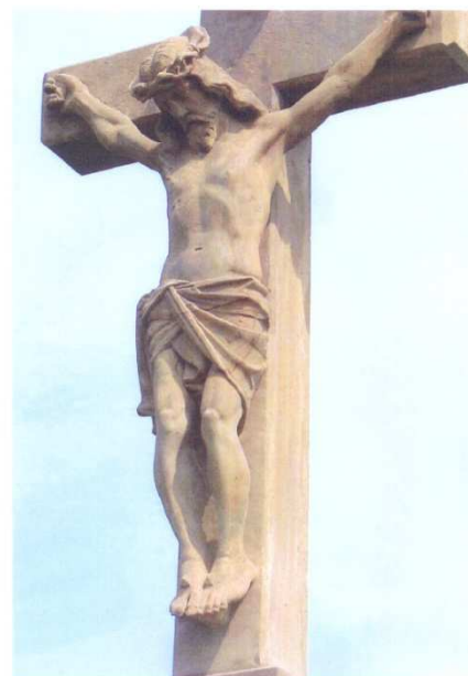
Haňovice, kamenný kříž, 2011 v místní části Kluzov Detail postavy Krista po dokončení restaurování.