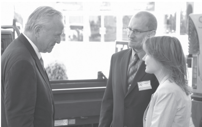
Hostem prvního ročníku setkání byl též William Cabaniss, tehdejší velvyslanec USA v ČR.

Bližší informace o programu, resp. vystupujících a hostech, spolu s přihláškami pro veřejnou správu a možnosti prezentace soukromých firem na setkání jsou k dispozici na www.regionservis.cz .